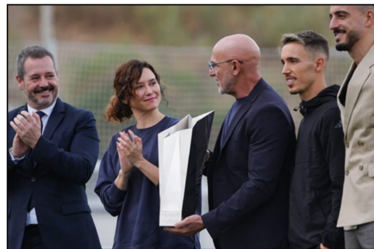
La Selección Española recibe Premio Internacional del Deporte de la CAM

Isabel Díaz Ayuso reconoce a la selección tras su histórica victoria en la Eurocopa 2024.