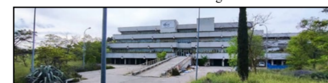
© El TSJM ratifica la continuidad de las obras del centro

El TSJM argumenta que es necesario adaptar las instalaciones para atender a la creciente llegada de menores no acompañados a