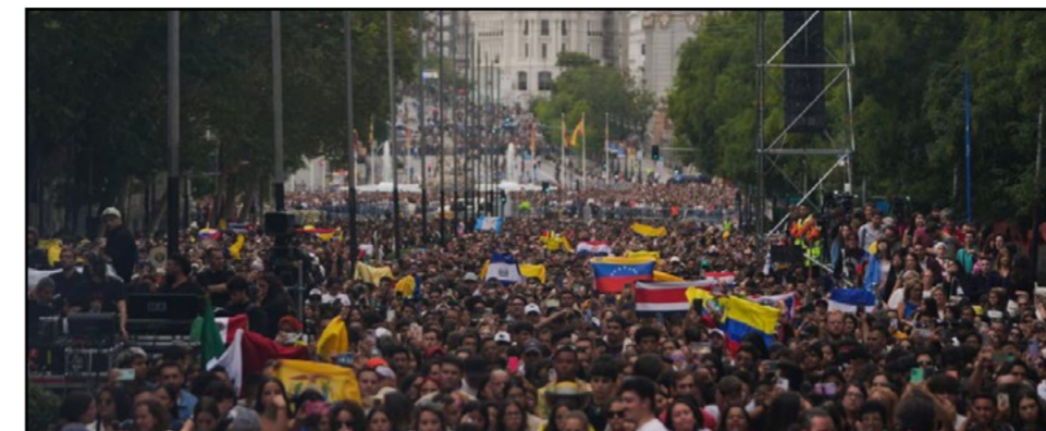
Pinto se posiciona entre los diez ayuntamientos más transparentes de la Comunidad de Madrid

La Comunidad de Madrid celebra la cuarta edición de Hispanidad con 184 actividades y 750 artistas de 22 nacionalidades.