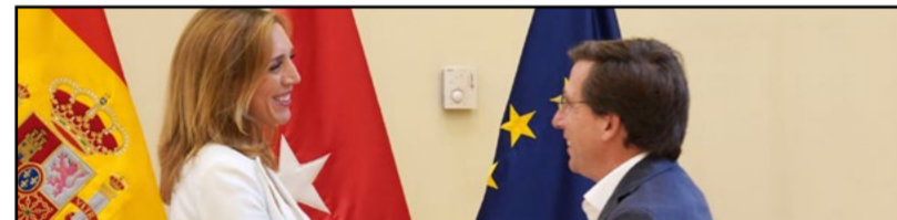
Plan de choque contra la delincuencia en Parla

La alcaldesa de Alcorcón, Candelaria Testa, se reunió con el alcalde de Madrid, José Luis Rodríguez Almeida, para discutir las implicaciones del soterramiento de la A-5 en la movilidad regional.