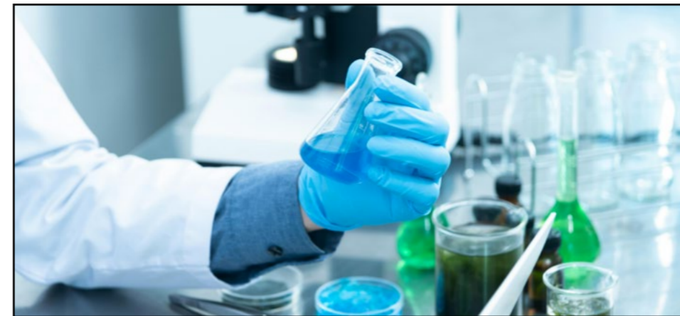
Abren inscripciones para la XXIV Semana de la Ciencia y la Innovación

La Comunidad de Madrid ofrecerá 1.600 actividades gratuitas en 20 municipios del 4 al 17 de noviembre.