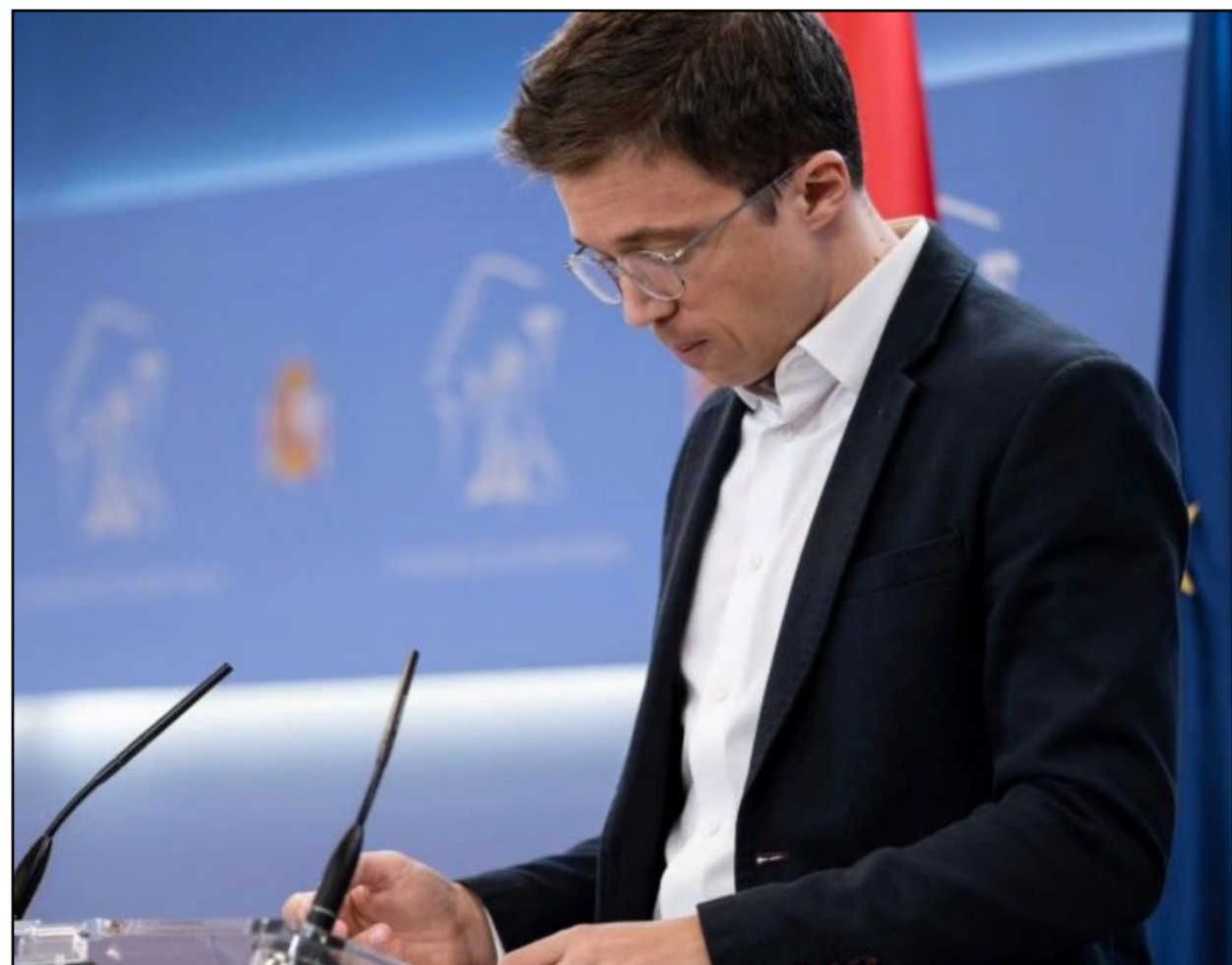
Íñigo Errejón deja la política y su escaño en el Congreso

El político, que inició su carrera en Podemos en 2016 y luego fundó Más País en 2019, ha enfrentado una creciente presión, especialmente tras la creación de Sumar. En su carta de despedida, agradece a sus compañeros y afirma que su decisión es un intento de reparar errores del pasado y cuidar su bienestar.