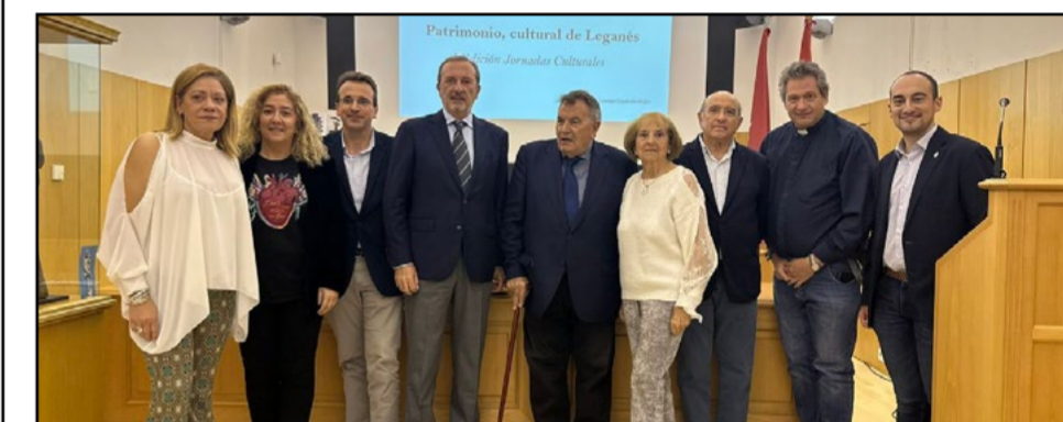
Inauguran las I Jornadas Culturales de ACL24 en Leganés

Las jornadas continuaron con una sesión sobre el Museo de Esculturas al Aire Libre 'Luis Arencibia', y culminaron el viernes con un recital gratuito del Coro de Las Rozas en la Parroquia de San Salvador, cerrando un programa cultural enriquecedor para la ciudad.