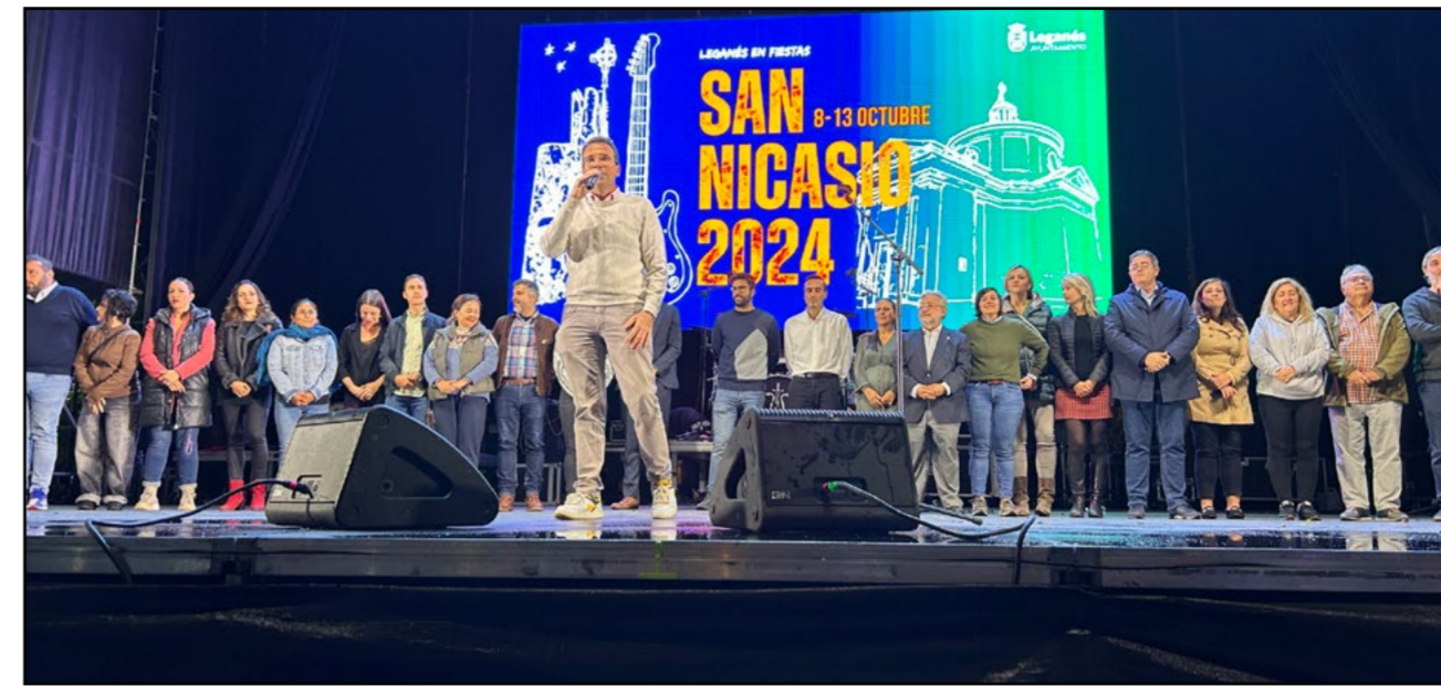
Éxito de las Fiestas de San Nicasio con amplia oferta musical y actividades paralelas

Pese al tiempo inestable, miles de personas participaron en los conciertos y el Desfile por el Día de la Hispanidad en Leganés.