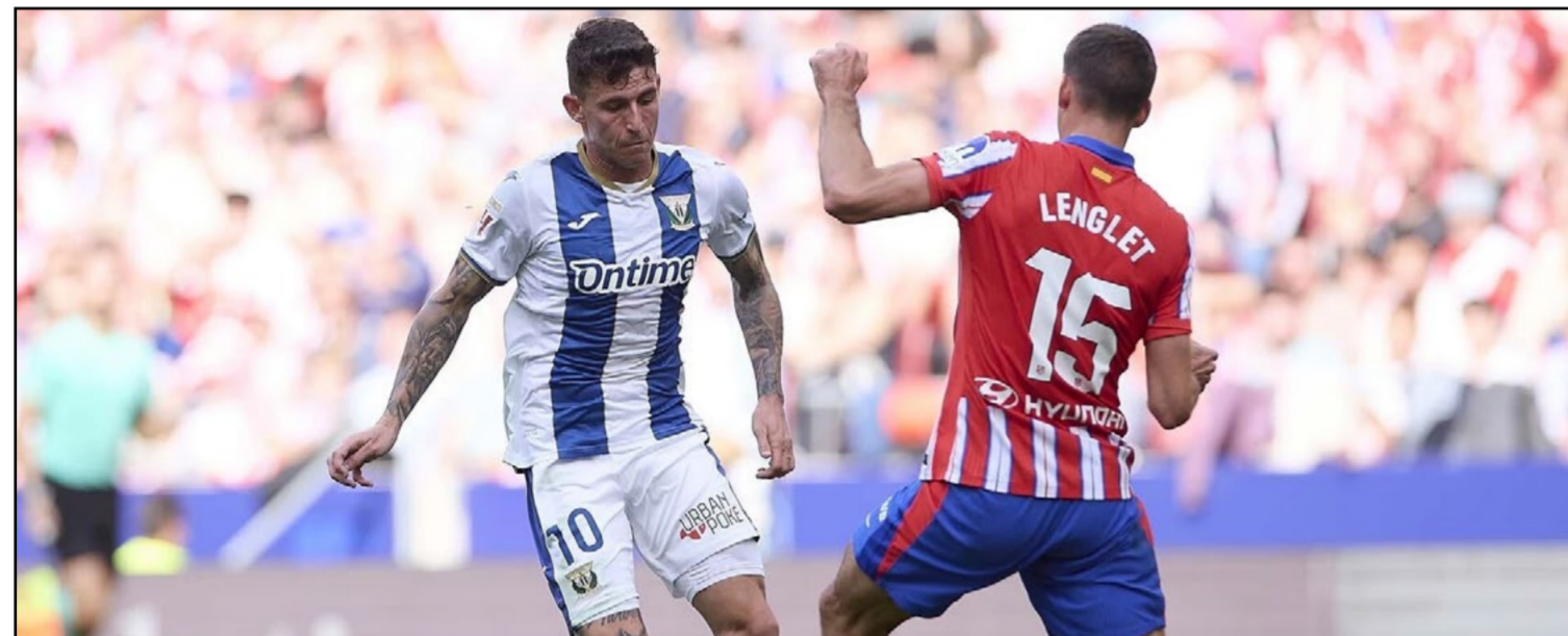
El C.D. Leganés cae ante el Atlético de Madrid en el Metropolitano (3-1)

da parte, el Atlético intensificó su presión y logró igualar en el minuto 69 con un gol de Sorloth, quien anotó de tacaño tras un pase de Witsel. Posteriormente, Griezmann marcó el 2-1 en el minuto 81, y en el tiempo de descuento, Sorloth selló el 3-1 definitivo. Con esta derrota, el Leganés se queda con ocho puntos en la clasificación y se prepara para recibir al R.C. Celta el próximo domingo en Butarque.