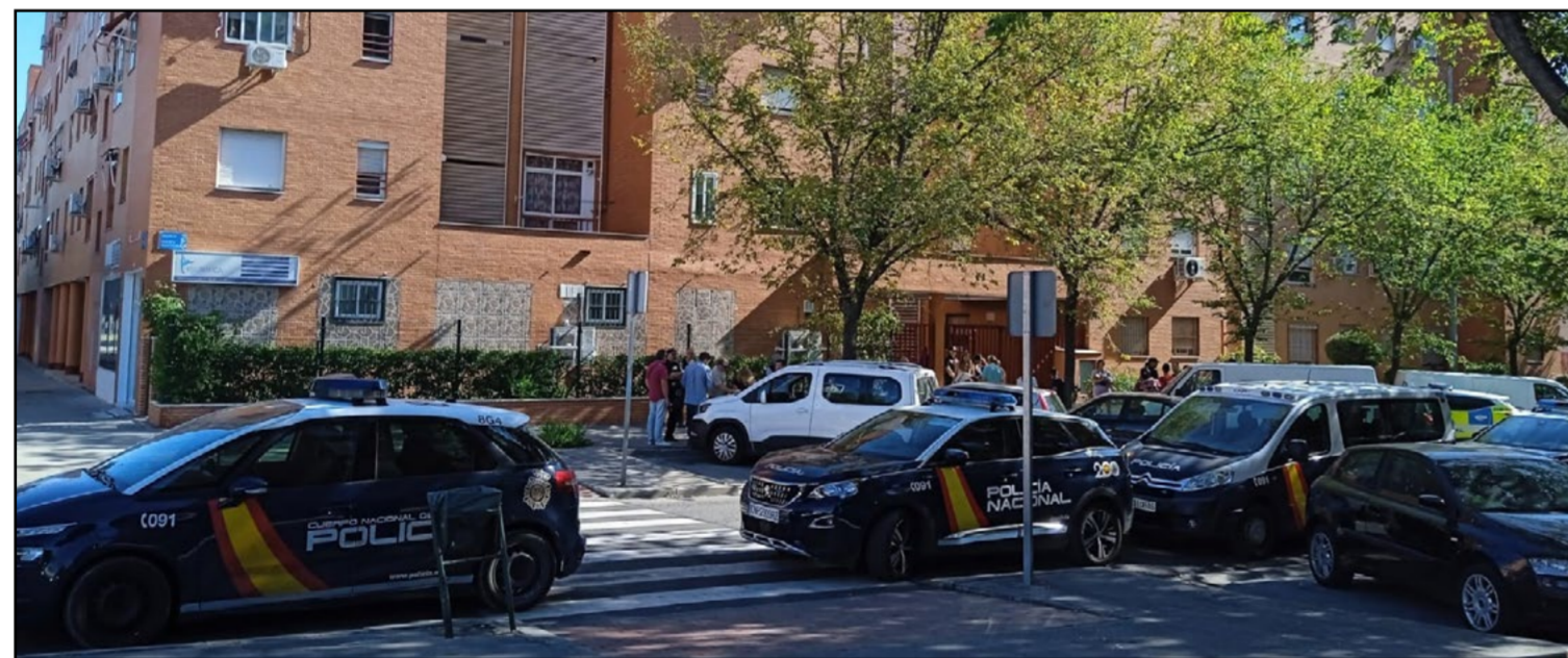
El Gobierno de Leganés se compromete a ayudar a 15 familias en riesgo de desahucio