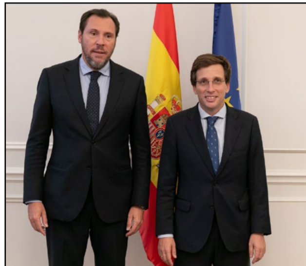
Puente y Almeida