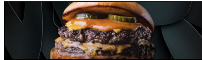
The Champions Burger

El Recinto Ferial de Leganés será el escenario de la gran final de 'The Champions Burger', un evento que se celebrará del 31 de octubre al 24 de noviembre. Durante estas fechas, los leganenses y visitantes podrán votar por la "Mejor hamburguesa de España". Un total de 24 hamburgueserías, que han superado fases clasificatorias previas, competirán por el título, incluyendo la