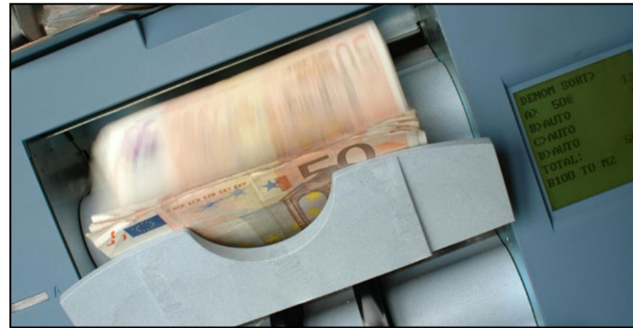
El Colegio de Economistas mantiene su previsión de crecimiento del 2,9% para 2024

Se eleva la estimación de crecimiento para 2025 al 2,3% y se espera una ligera reducción de la inflación