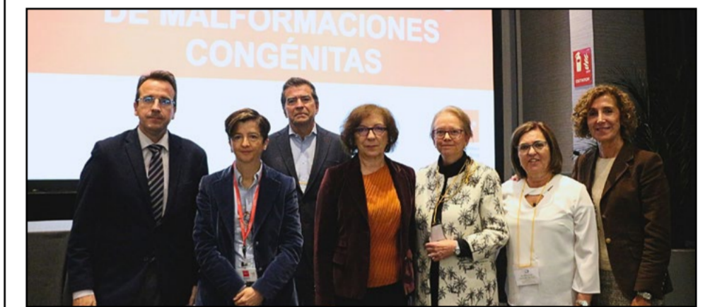
© La Reina Letizia preside la 45ª reunión del ECEMC en el Hospital Severo Ochoa

Este esfuerzo conjunto entre el Hospital Severo Ochoa y otras entidades dedicadas a la investigación se espera que mejore la atención pediátrica y la calidad de vida de los niños afectados.