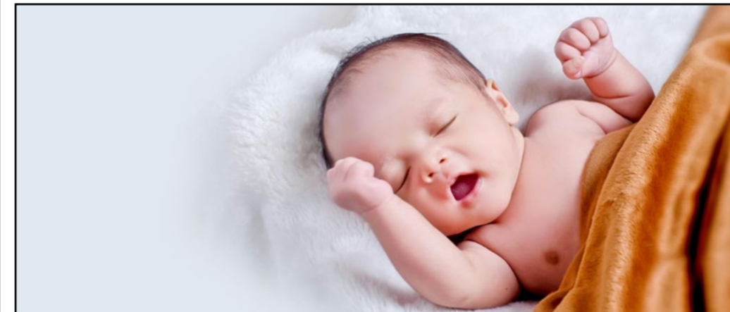
Madrid introduce 'cheques bebé' de hasta 1.000 euros para fomentar la natalidad a partir de junio de 2025

Martínez-Almeida también señaló que, según el CIS, el 77% de los españoles no tiene más hijos debido a la falta de recursos económicos. Para contrarrestar esta situación, se crearán 2.000 plazas adicionales en campamentos de Navidad, Semana Santa y verano. También se reservará el 10% de las promociones de la EMVS para aquellas familias que hayan tenido un bebé en el último año, como parte de las medidas para fomentar la natalidad y apoyar a las familias