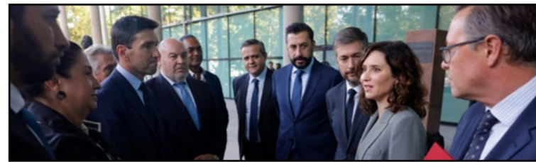
© Díaz Ayuso exige fondos para la recuperación afectados por la DANA

La presidenta de la Comunidad de Madrid, Isabel Díaz Ayuso, ha solicitado al Gobierno central el 50% de los costes de inversión para la recuperación de infraestructuras en nueve localidades afectadas por la DANA que azotó la región en septiembre del año pasado.