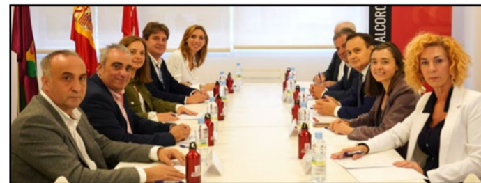
© Nueve alcaldes de Comunidad de Madrid se unen

El objetivo es modificar la Ley del Suelo de 2001, permitiendo declarar zonas de mercado residencial tensionado y propiciar vivienda asequible. Esta iniciativa responde a la Ley 12/2023, que establece el derecho a la vivienda. Los alcaldes defienden que la vivienda es un derecho, no un bien de mercado, y apuestan por políticas públicas que favorezcan el acceso a vivienda protegida y asequible. Además, buscan crear un marco de actuación que beneficie a los 179 municipios de la comunidad, promoviendo la cooperación entre administraciones para garantizar este derecho fundamental y el desarrollo de los ciudadanos.