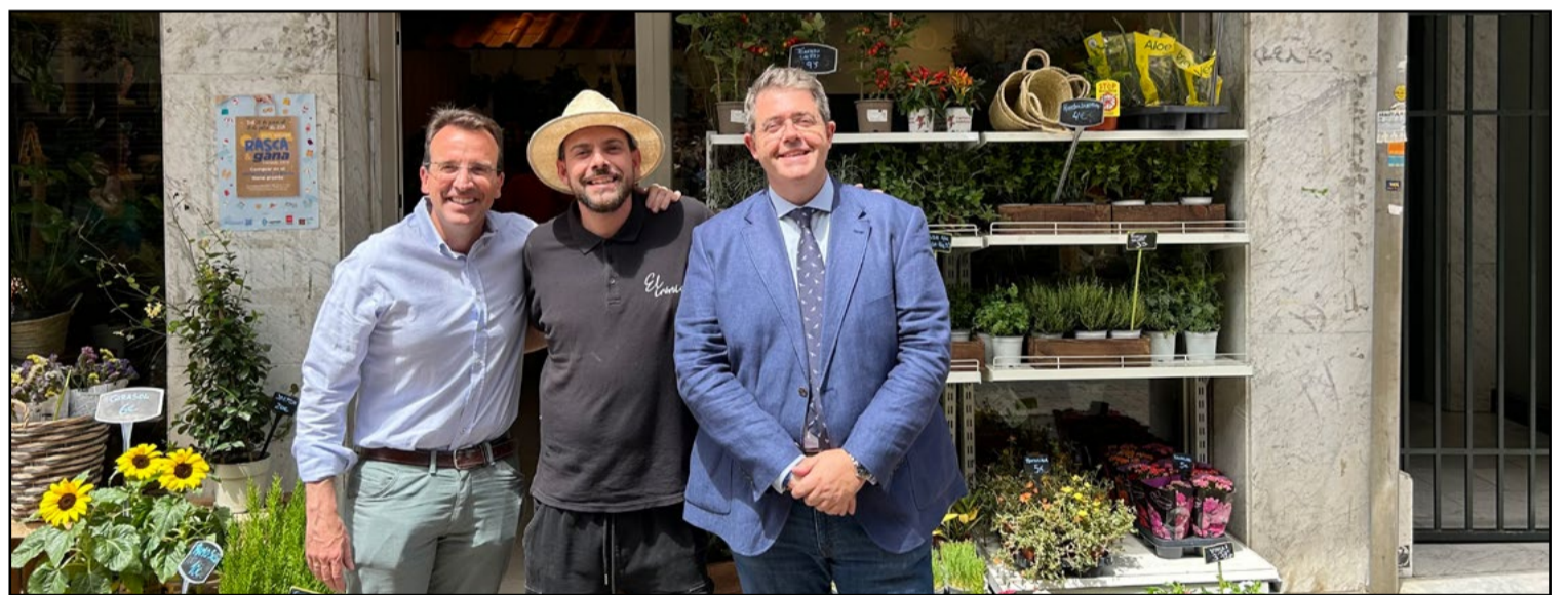
Más de 330 comercios se adhieren a la Campaña del 'Rasca y Gana en Leganés'

Esta iniciativa tiene como objetivo apoyar el comercio local y premiar a los vecinos por sus compras, ofreciendo cuatro cheques de 500 euros cada uno para canjear en los establecimientos participantes.