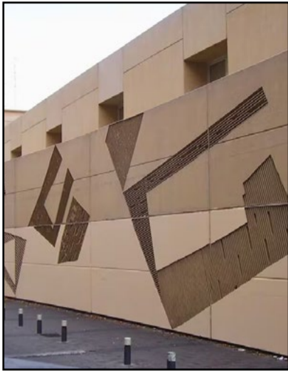
Centro de Salud

El centro de salud Mª Ángeles López Gómez en Leganés se queda sin pediatras y la alternativa está a más de una hora.