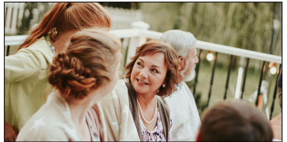
Familia en evento

Esta disparidad también afecta la esperanza de vida. En Alcorcón, es de 84,3 años, casi dos años menos que en municipios del norte como Boadilla (86,1 años). Aunque la vivienda en el sur es más accesible, la diferencia en calidad de vida y esperanza de vida sigue siendo notable.