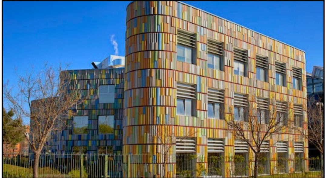
© Ayto. Leganés - Las Bibliotecas Municipales de Leganés

Las actividades casi se triplican en el primer semestre de 2024, alcanzando un total de 354 eventos y la participación de 18,751 personas, gracias a la ampliación de horarios y días de apertura.