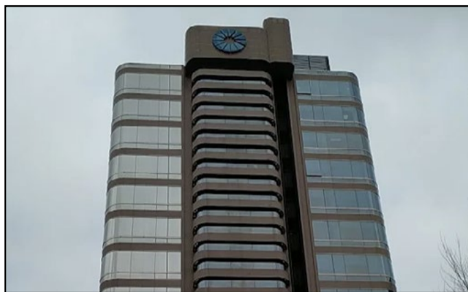
Dos hombres condenados

pefacientes. Los condenados almacenaban resina de cannabis, éxtasis y ketamina en una vivienda de Getafe, donde la Policía Nacional intervino en 2021, incautando las drogas y 140.500 euros en efectivo. La intervención policial, que comenzó tras una llamada de madrugada sobre un posible robo, reveló las sustancias ilegales en el registro de la vivienda. Aunque la pena es de dos años, se suspende por tres años bajo la condición de no cometer más delitos. Además, los acusados deberán pagar una multa de 12.530 euros.