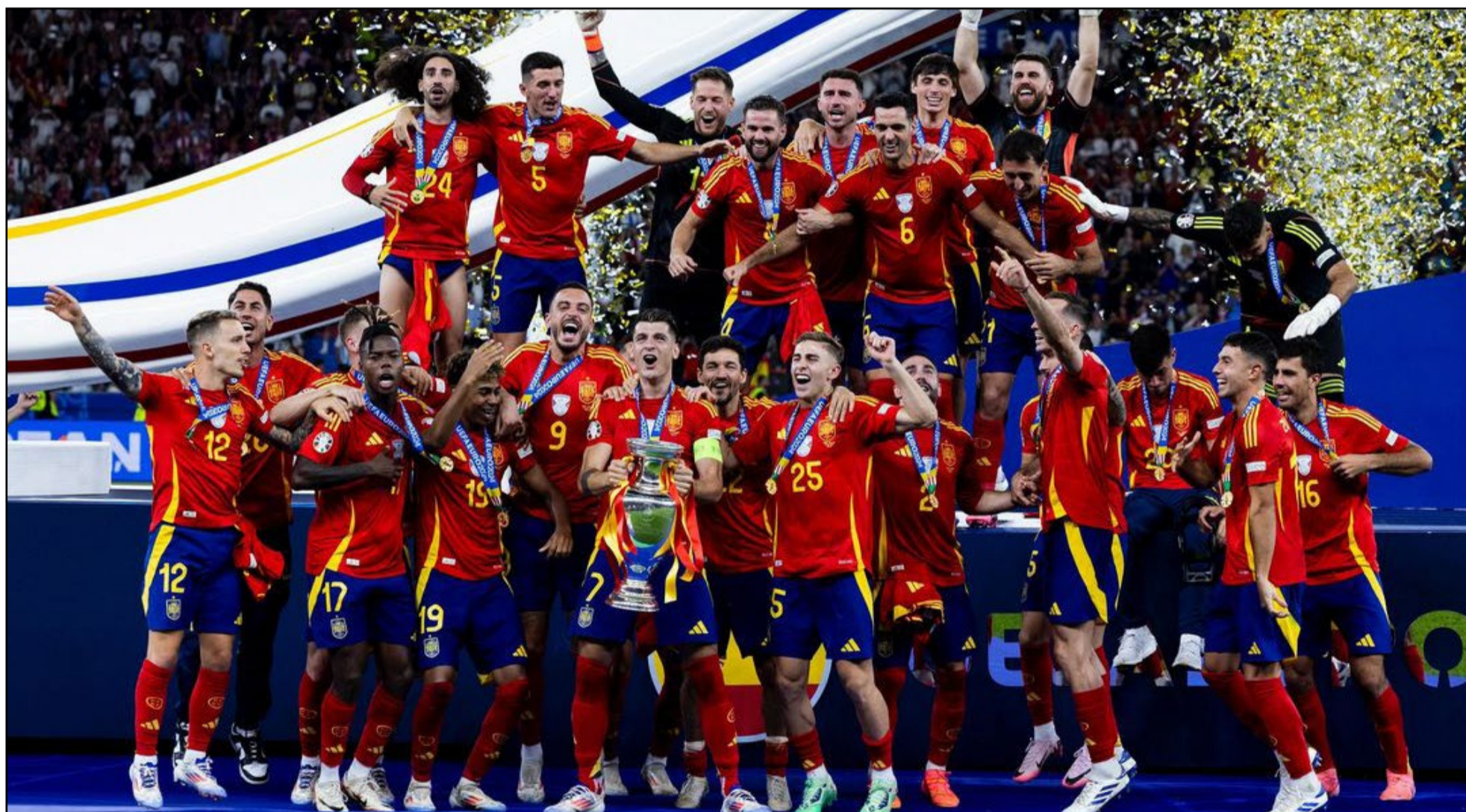
España conquista su cuarta Eurocopa en una final épica contra Inglaterra

La final también sirvió de revancha para España, que había sido eliminada por Inglaterra en los cuartos de final de la Eurocopa de 1996. Veintiocho años después, España se impuso con justicia, dejando claro que es la reina del fútbol europeo. La victoria no solo refuerza su dominio, sino que también deja una huella imborrable en la historia del fútbol.