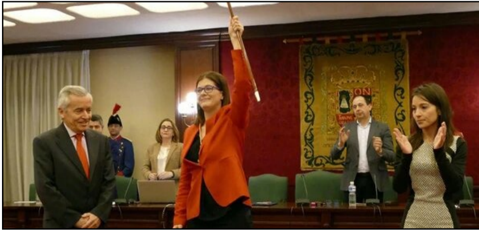
exalcaldesa de Móstoles

El juez declara que la exalcaldesa vulneró el derecho a la tutela judicial efectiva de las demandantes tras cesarlas por asistir a una asamblea sindical.