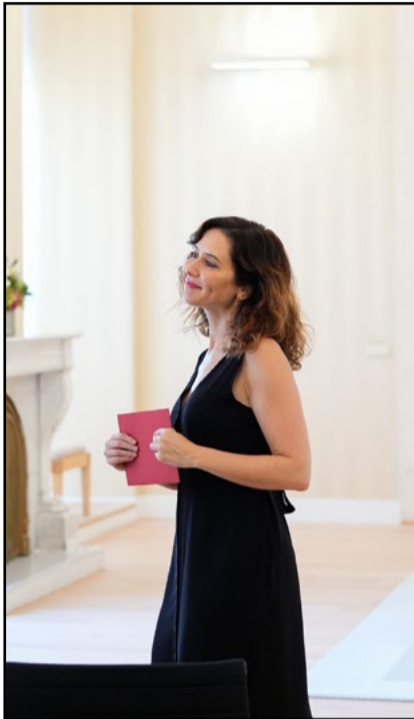
© CAM | Díaz Ayuso y Asensio Martínez