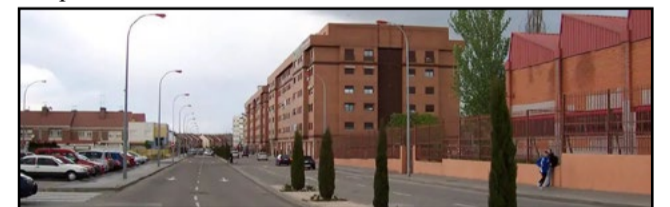
Calles en Parla

joven en mayo y la apuñaladura de un hombre en junio. El 13 de julio, tres policías resultaron heridos durante un arresto relacionado con un robo. Además, la reciente desarticulación de una banda de tráfico de marihuana ha acentuado la inseguridad. El Ayuntamiento afirma estar trabajando en soluciones, pero los residentes piden mayor presencia policial y programas de prevención efectivos.