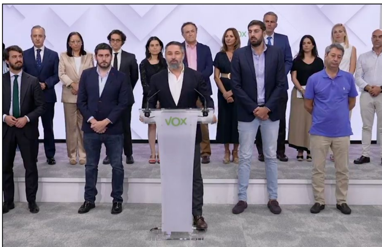
© X: @vox_es | Vox rompe los gobiernos de coalición con el PP en cinco comunidades autónomas

En Baleares, aunque el PP gobierna en solitario, la ruptura del pacto de legislatura con Vox complicará la aprobación de nuevas leyes. Sin el apoyo de Vox, el gobierno balear deberá buscar alianzas alternativas para avanzar en su agenda legislativa, enfrentando un panorama político más incierto y complejo.