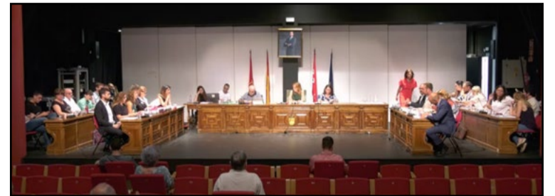
Pleno municipal