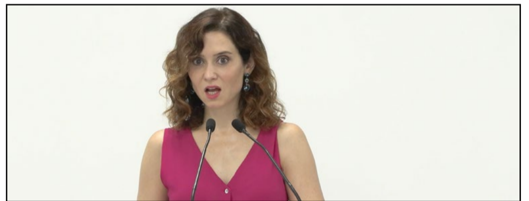
Isabel Díaz Ayuso

Desde 2019, la Comunidad de Madrid ha reducido los impuestos en 21 ocasiones, con un ahorro total de 31.000 millones de euros para los madrileños, equivalente a unos 8.700 euros por contribuyente. Este nuevo paquete fiscal se suma a estas iniciativas, buscando no solo apoyar a los ciudadanos frente a los retos económicos actuales, sino también fortalecer el mercado inmobiliario regional y estimular el crecimiento de los municipios más pequeños.