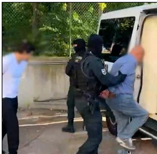
Hombres detenidos en Majadahonda

Las víctimas, dos hombres, fueron golpeadas y forzadas a subir a una furgoneta; los agentes lograron liberarlas y arrestar a los secuestradores.