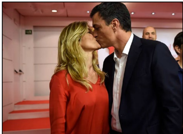
Pedro Sánchez y Begoña Gómez