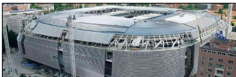
Santiago Bernabéu