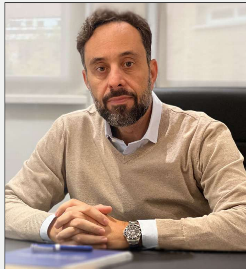
© Antonio Miguel Expósito Martín | CEO de LGN Medios

Sabemos que el actual equipo de gobierno no lo tiene fácil, pero les pedimos que no se acobarden y que obliguen al resto de partidos a colaborar y a dar la cara.