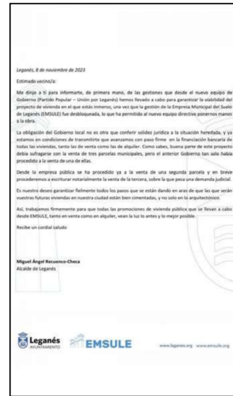
Carta ayuntamiento

La carta del alcalde asegura progresos en la viabilidad del proyecto, con acciones para garantizar los cimientos de las viviendas