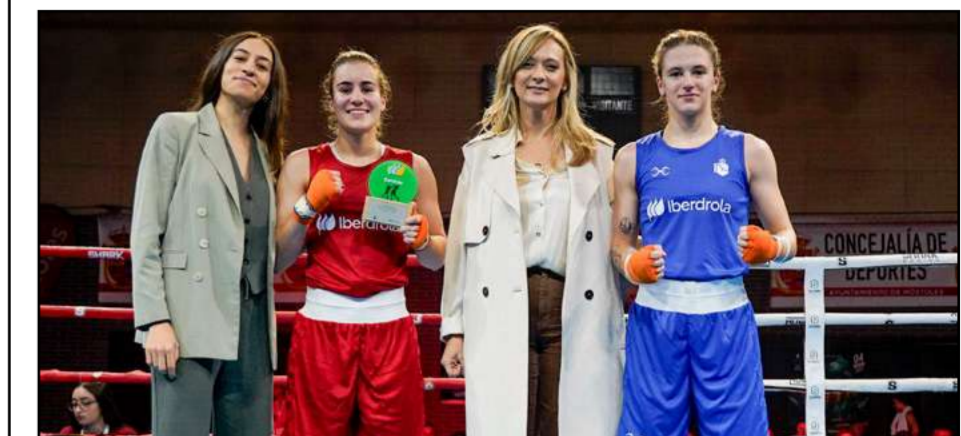
Copa Boxeo Iberdrola

Móstoles llena estadio, 800 asistentes y 3.000 seguidores online. Combates destacados consolidan la ciudad como epicentro del boxeo femenino.