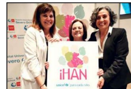
Recibiendo la acreditación

La reacreditación destaca el esfuerzo continuo del centro por humanizar el parto, cuidar a recién nacidos y apoyar a madres