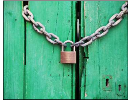
Imagen de un candado

La falta de apoyo financiero podría cerrar 'Mil diferencias', dejando a nueve residentes en una situación precaria