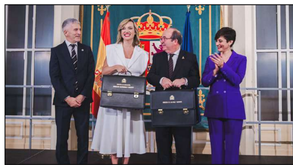
© Pilar Alegría | Ministerio Educación

Al asumir el cargo de Portavoz del Gobierno, Alegría se muestra optimista y afirma su creencia en el proyecto de país.