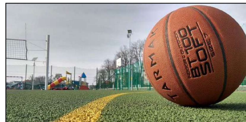
Pelota de Baloncesto

El horario único de media jornada, de 9:00 a 14:00 horas, ofrece flexibilidad con opciones de horario ampliado de 8:00 a 9:00 y comida de 14:00 a 15:00 horas. Los pabellones municipales Juan de la Cierva y Felipe Reyes serán los escenarios perfectos para este evento, que se realiza en colaboración con www.cbgetafe.es y está dirigido a niños y jóvenes de 7 a 17 años. La inscripción es sencilla, solo hay que visitar campusgigantes.com y completar el formulario para unirse a esta experiencia única de baloncesto durante las vacaciones de Navidad.