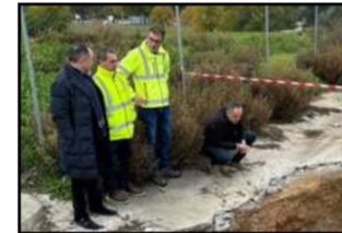
Cierre A-5

El 12 de noviembre, un socavón bajo la vía de servicio de la A-5 sentido Madrid, cerca del Campus de Móstoles de la Universidad Rey Juan Carlos, llevó al cierre indefinido de la vía desde el enlace de Móstoles El Soto. Ante esta situación, se han establecido rutas alternativas y se ha habilitado un enlace directo provisional a la A-5 sentido Madrid.