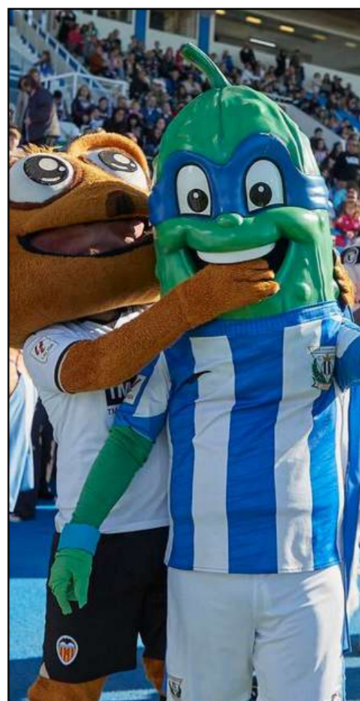
La liga de las mascotas

El evento tuvo un impacto solidario, con el club y la Fundación C.D. Leganés colaborando con el Banco de Alimentos de Madrid. Los aficionados tuvieron la oportunidad de donar alimentos no perecederos en dos stands, contribuyendo así a hacer de estas navidades un momento más especial.