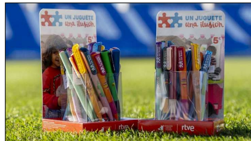
Estadio de fútbol

La campaña en colaboración con la Fundación Crecer Jugando y RTVE busca llevar alegría a niños en más de cincuenta países.