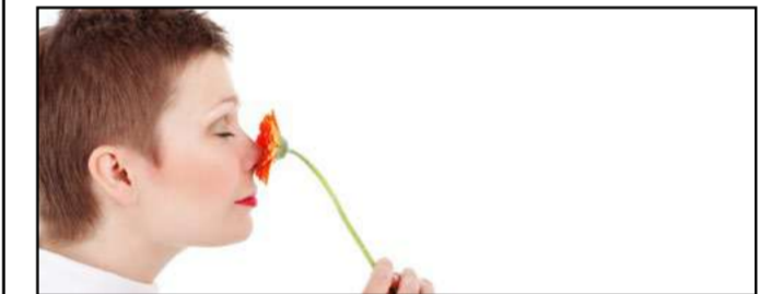
Persona oliendo flor

Descubren un tratamiento para la pérdida del olfato por Covid. Han identificado un tratamiento potencial para la pérdida del sentido del olfato en pacientes con Covid