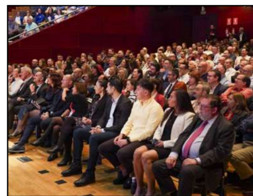
XVII Gala del Deporte

A nivel local, se premió a jóvenes talentos, la Asociación de Comerciantes de Móstoles recibió el Premio Patrocinador del Año, y la Escuela de Atletismo de Móstoles fue reconocida por promover el juego limpio en el deporte base. La gala reflejó el compromiso del Ayuntamiento con el deporte como elemento clave en la identidad de Móstoles.