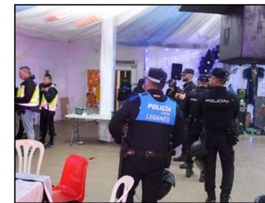
Redada al polígono

Cerca de 700 personas desalojadas y tres naves industriales precintadas en Prado Overa