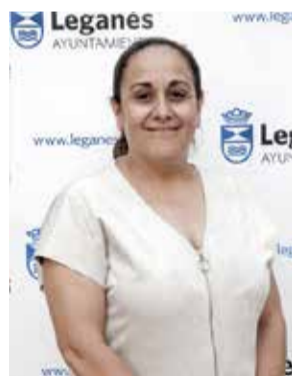
Beatriz Tejero VOX