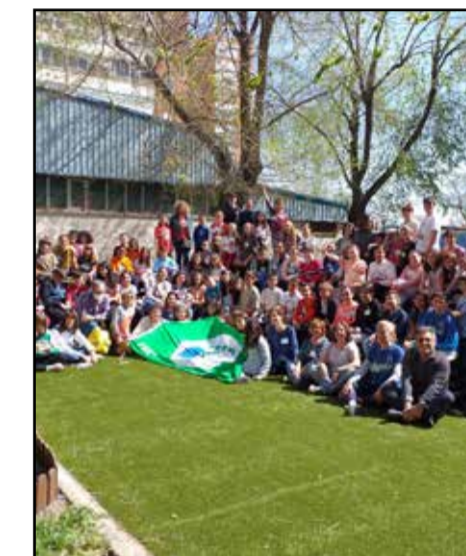
Programa de convivencia

dades y Recursos Educativos, disponible en el sitio web del Ayuntamiento de Leganés. Allí, los interesados pueden consultar información detallada sobre la guía y los diversos cursos, talleres y seminarios disponibles.