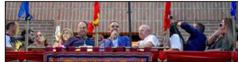
Pregón de fiestas

El punto álgido de la noche llegó con el espectáculo de fuegos artificiales, un total de 764 kilos de pólvora que iluminó el cielo de Móstoles.