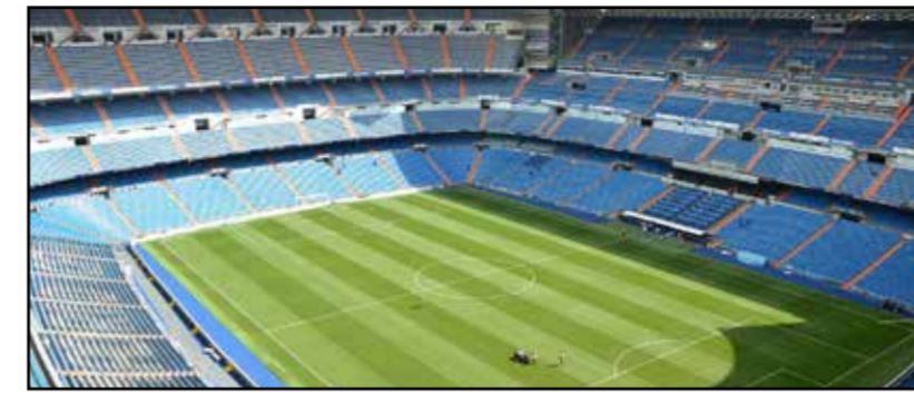
Estadio de futbol

LA POLICÍA JUDICIAL DE LAS PALMAS INVESTIGA EL CASO, QUE INVOLUCRA A JUGADORES DE LA CANTERA Y PODRÍA AFECTAR A LA INTEGRIDAD DEL CLUB BLANCO