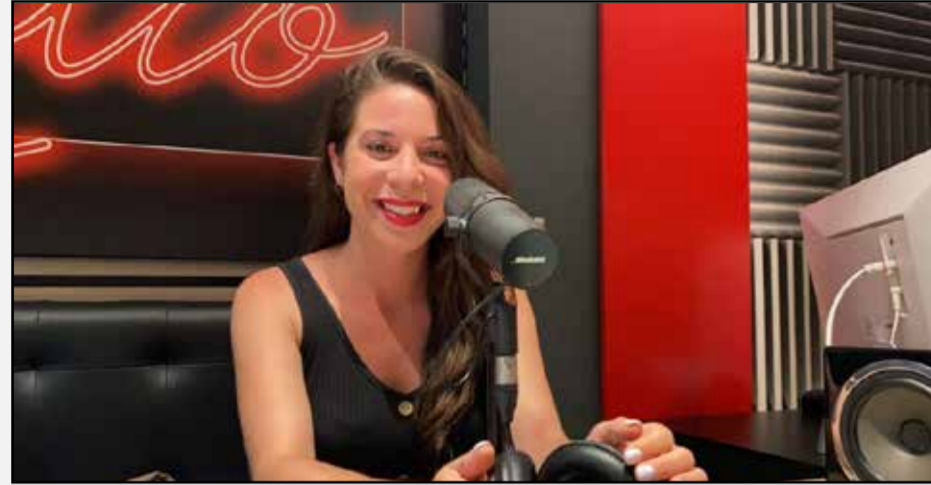
© LGN Medios | Alba Pulido

Alba Pulido, portavoz de Unidas Podemos-Izquierda Unida-Alianza Verde en el Ayuntamiento de Leganés, es una destacada líder política conocida por su compromiso con la justicia social y la sostenibilidad ambiental. Su dedicación en el ámbito municipal la ha convertido en una voz influyente en la defensa de los derechos y el bienestar de la comunidad local.