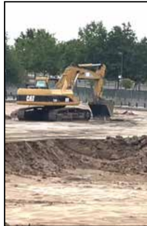
Obras del Emsule

TRAS ENCONTRARSE UNA SITUACIÓN INESPERADA POR LA PRESUNTA FALTA DE FINANCIACIÓN PARA LA CONSTRUCCIÓN DE LAS VIVIENDAS DE EMSULE LA NUEVA CORPORACIÓN BUSCA SOLUCIONES