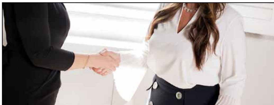
Entrevista de trabajo

Se ha anunciado una inversión de 90 millones de euros para el año 2023 con el objetivo de promover la contratación de personas que enfrentan mayores dificultades para acceder al mercado laboral . Esta iniciativa busca beneficiar a colectivos como parados de larga duración, desempleados de municipios rurales y personas mayores de 45 años , brindándoles oportunidades laborales y capacitación.