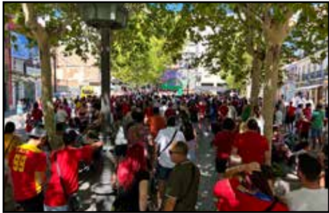
Plaza España durante el partido

Con un estruendoso grito de triunfo que resonó en todo el país, España selló su victoria en el Mundial femenino de fútbol, dejando una marca indeleble en la historia del deporte y en la lucha por la igualdad de género. Un ajustado marcador de 1-0 otorgó a las jugadoras españolas el merecido puesto en lo más alto del podio, trascendiendo más allá del terreno de juego y convirtiéndose en un simbólico paso hacia la equidad en el mundo deportivo.