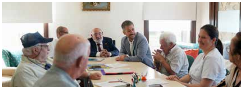
Reunión