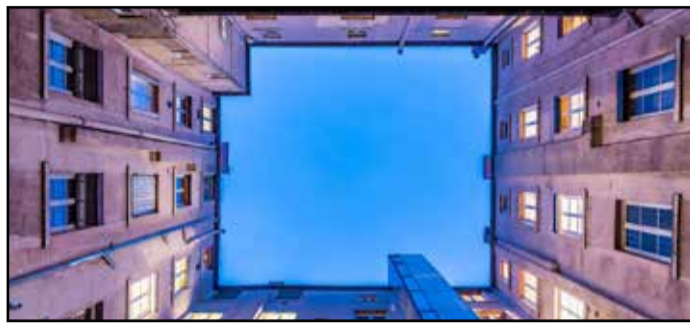
Patio edificios

LOS CUERPOS EN AVANZADO ESTADO DE DESCOMPOSICIÓN SON DE UN MATRIMONIO ENCONTRADOS EN UN PISO DE LA CALLE FÉLIX RODRÍGUEZ DE LA FUENTE