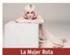
La Mujer Rota

Viernes 8 de mayo / 20:00h Teatro José Mosleón