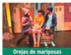
Orejas de mariposas

Sábado 14 de marzo / 20:00h Teatro José Mosleón