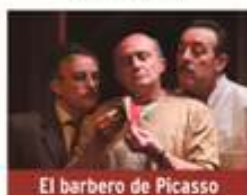
El barbero de Picasso

Sábado 9 de mayo / 20:00h Teatro José Mosleón