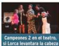
Campeones 2 en el teatro, si Lorca levantara la cabeza.

Viernes 20 de marzo / 18:30h Teatro Rigoberta Menchú