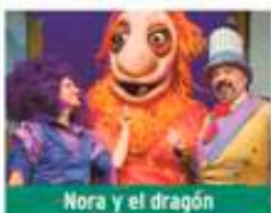
Nora y el dragón

Sábado 11 de abril / 20:00h Teatro José Mosleón