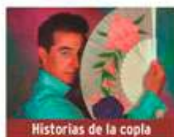
Historias de la copla

Viernes 6 de marzo / 20:00h Teatro José Mosleón