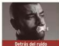
Detrás del ruido

Viernes 17 de abril / 20:00h Teatro José Mosleón