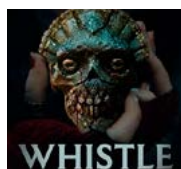
WHISTLE: EL SILBIDO DEL MAL