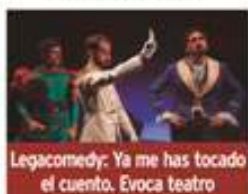
Legacomedy: Ya me has tocado el cuento. Evoca teatro

Viernes 17 de abril / 18:30h Teatro Rigoberta Menchú