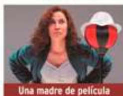
Una madre de película

Viernes 10 de abril / 20:00h Teatro José Mosleón