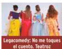
Legacomedy: No me toques el cuento. Teatroz

Viernes 6 de marzo / 20:00h Teatro José Mosleón