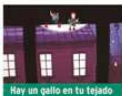
Hay un gallo en tu tejado

Viernes 27 de marzo / 19:00h Teatro Rigoberta Menchú