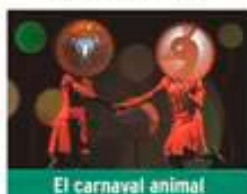
El carnaval animal

Sábado 25 de abril / 20:00h Teatro José Mosleón