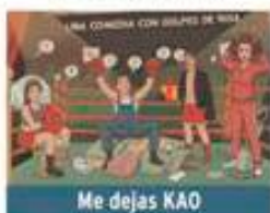
Me dejas KAO

Sábado 21 de marzo / 20:00h Teatro José Mosleón